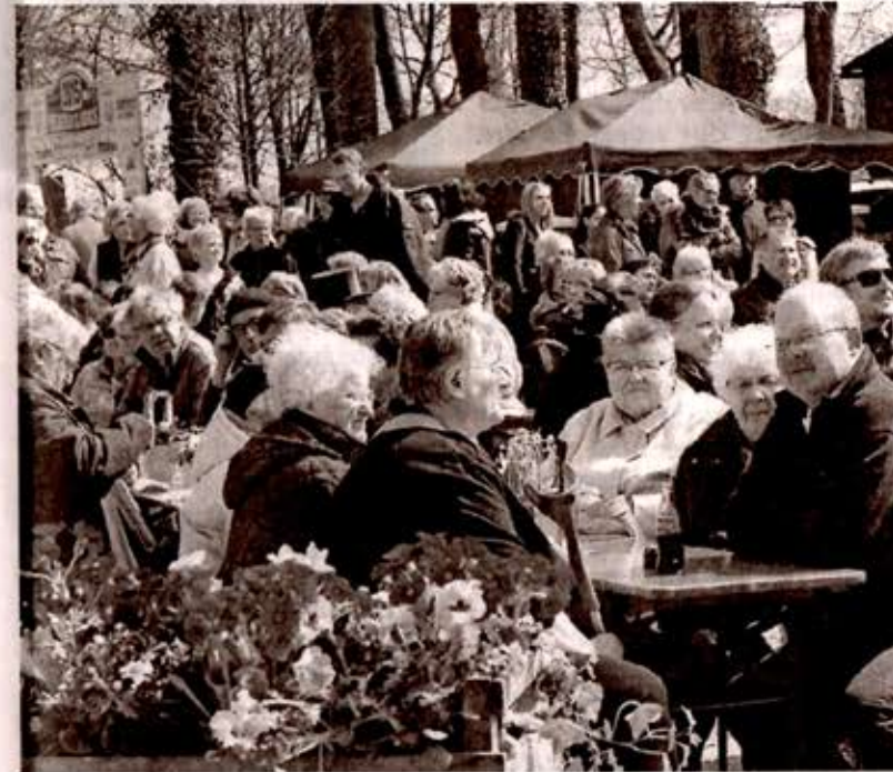
Großer Besucheransturm herrschte beim Fest auf dem Deinster Hof.