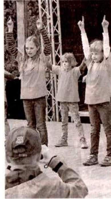
Kinder tanzen auf der Showbühne.